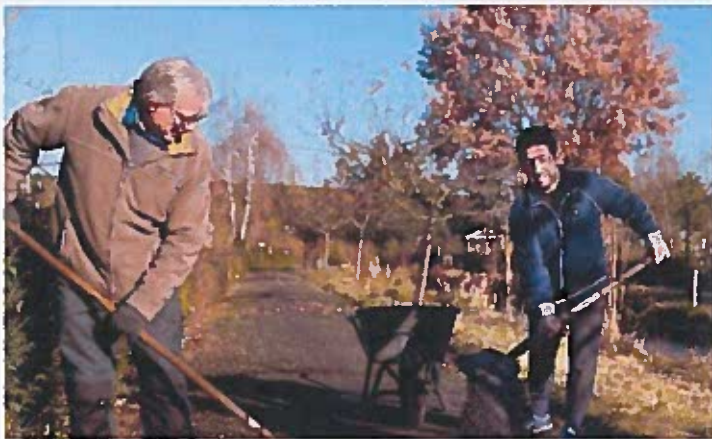
Bewoners doen op verschillende manieren vrijwilligerswerk

GZA schakelt telefonisch een tolk in als dat nodig is. Zowel bij het bellen naar de Praktijklijn, tijdens het inloopsprekeuur of bij een afspraak met een zorgverlener. Zo weet het GZA dat ze de bewoner begrijpen en kunnen zij zo goed mogelijke zorg verlenen.